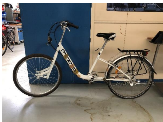
Figure 1 : Vélo expérimental avec la possibilité de modifier la position de la roue avant pour changer des caractéristiques géométriques.

L'objectif de ce projet sera de questionner la validité des indicateurs, théoriques et expérimentaux, via un protocole expérimental. Le but du protocole sera d'évaluer les indicateurs théoriques et expérimentaux d'un vélo (Figure 1) sur lequel il est possible de modifier la chasse (Figure 2) qui est une caractéristique géométrique connu pour avoir un impact sur le pilotage d'un vélo.